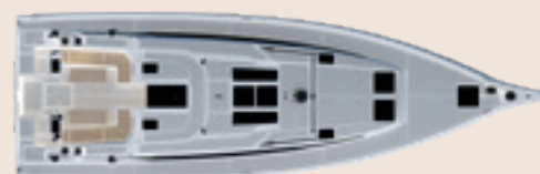
Deck layout Deck-Layout